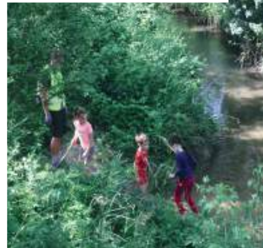
Opération « Grand nettoyage »