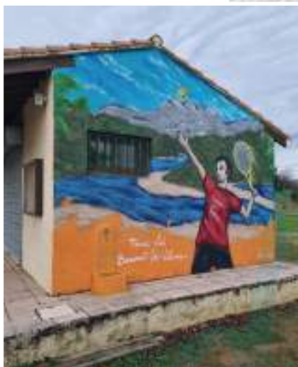
Fresque Tennis Club