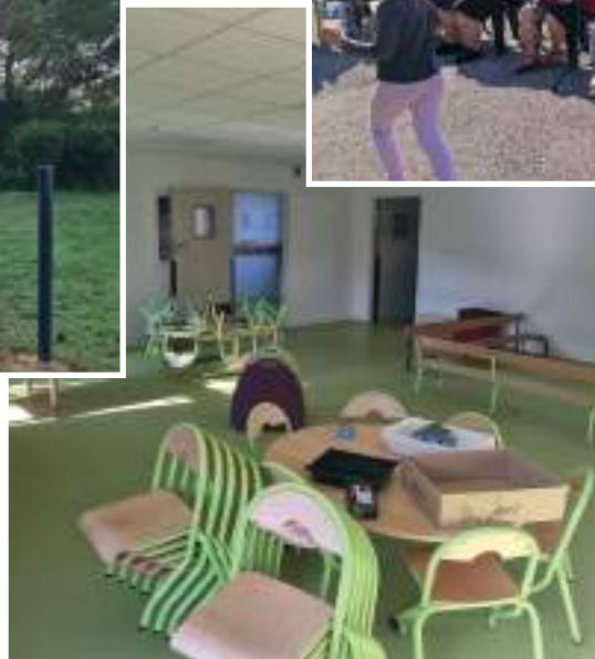
Nouvelle classe école maternelle Charles Perrault