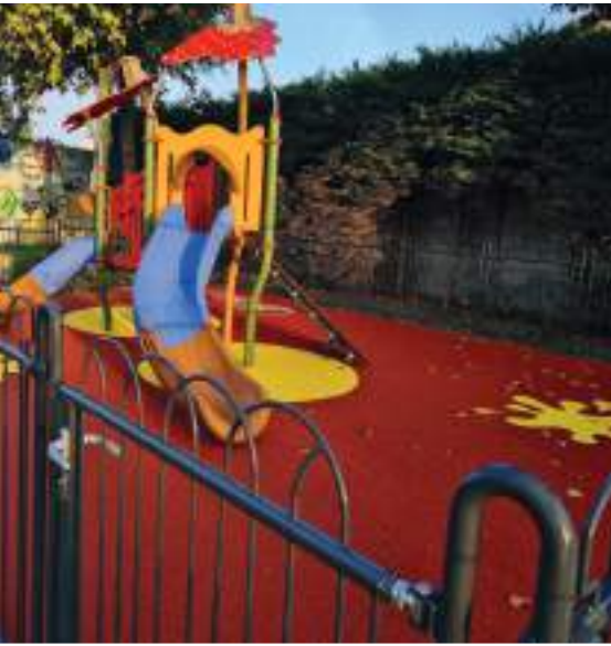
Square des Faures