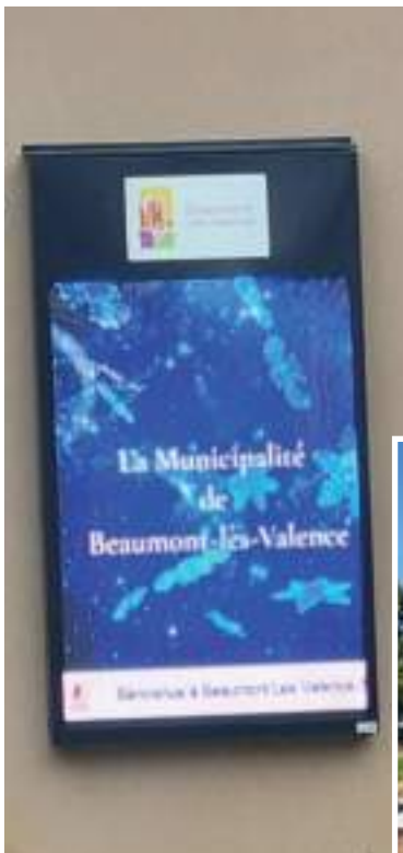
Panneaux lumineux mairie