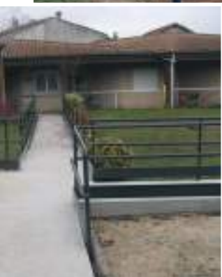
Travaux P.M.R Sérénides