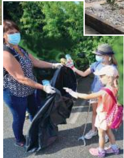
Opération « Grand nettoyage »