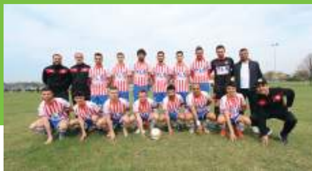
Équipe fanion ESB

Pour son développement, l'ESB a besoin de plus de dirigeants. Aussi, si vous êtes parents de joueurs, supporters du club ou passionnés de foot ou de sport, n'hésitez pas à venir nous rejoindre ( voir page Facebook : ESB - Entente Sportive Beaumontéleger ).