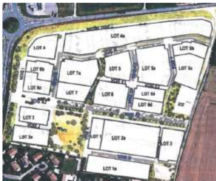
Repérage des lots (situation au 1 er avril 2022)

Tranche 3. Cette dernière tranche est livrable au plus tard en 2030. Elle fait l'objet de discussions entre l'aménageur, défenseur de son équilibre financier et la commune qui demande, entre autres, un « poumon vert » et une résidence pour séniors d'environ 30 places. L'objectif de 39 % de logements locatifs sociaux est respecté.