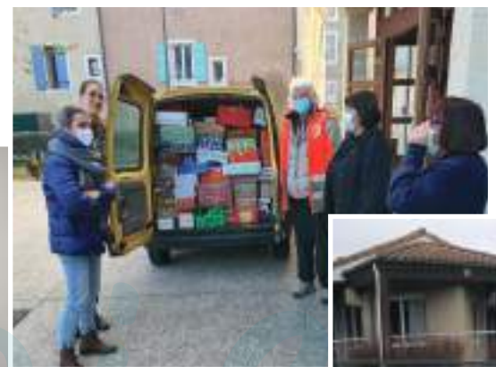
Colis de Noël