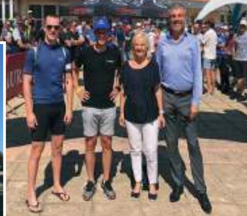
Nouvelles toilettes garçon école élémentaire Pierre Mendès France