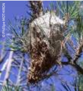
Nid sur branche