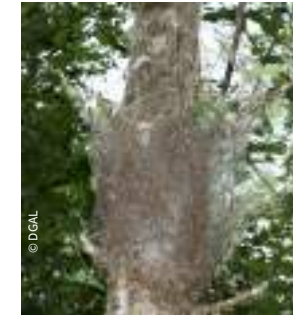
Nid sur branche